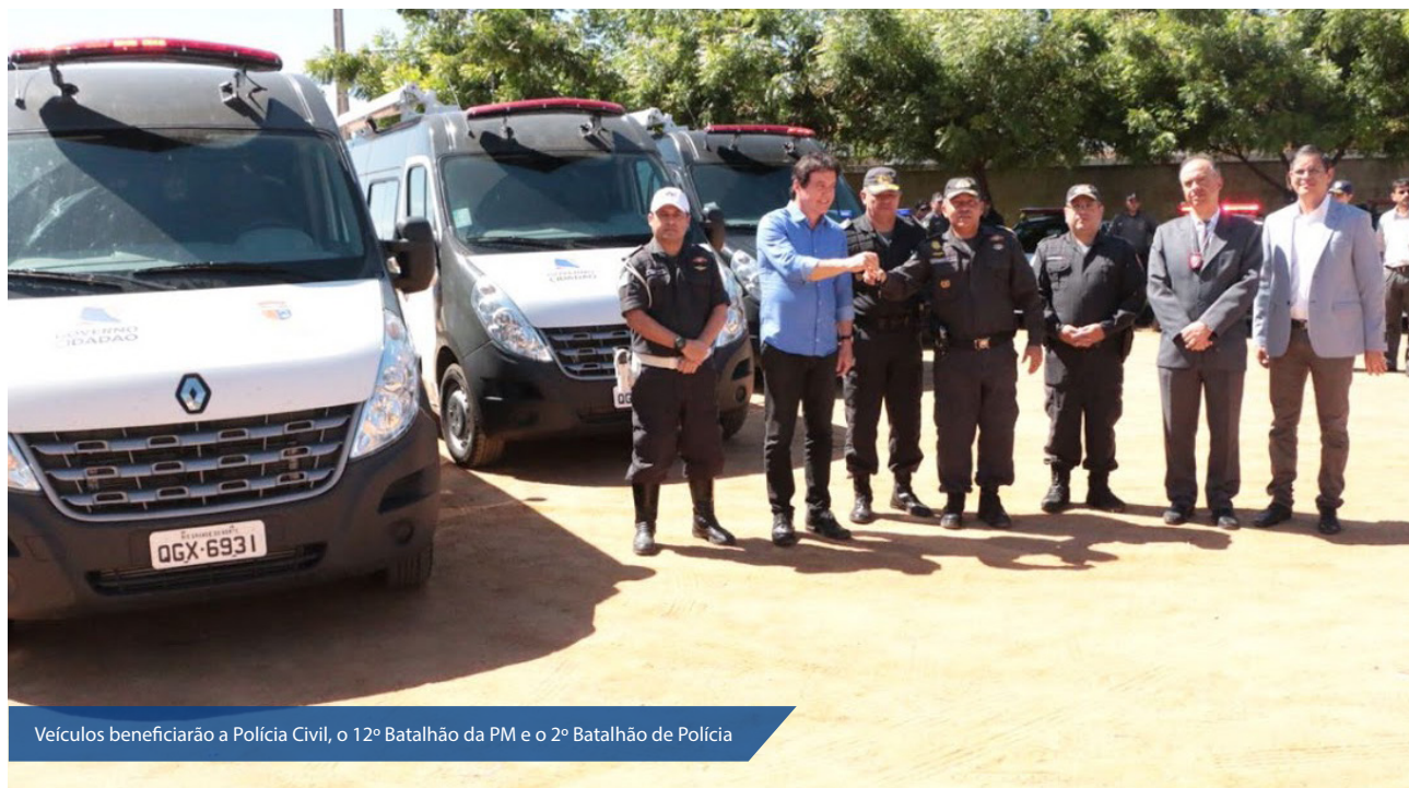
Veículos beneficiarão a Polícia Civil, o 12º Batalhão da PM e o 2º Batalhão de Polícia

Veículos entregues são do tipo Gol, Duster e vans para o serviço de Base Móvel de segurança pública