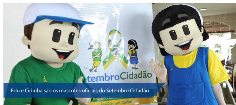
Edu e Cidinha são os mascotes oficiais do Setembro Cidadão

O cronograma das atividades segue com a realização do III Seminário Estadual de Educação Cidadã e a abertura do Setembro Cidadão no dia 29 de agosto. A programação contará com