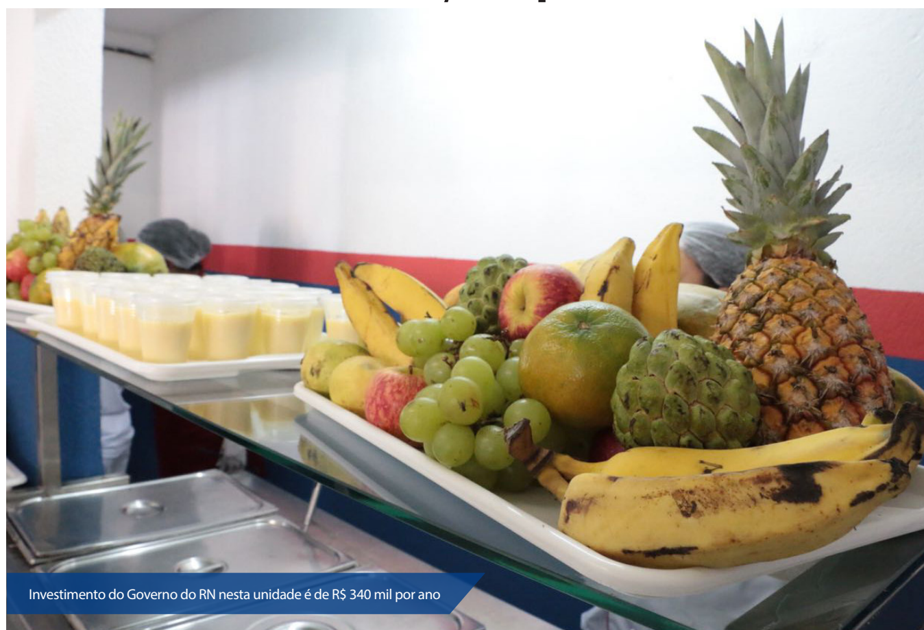
Investimento do Governo do RN nesta unidade é de R$ 340 mil por ano

A meta do Governo do RN é inaugurar mais duas unidades até o final de junho, sendo uma Natal, no bairro do Alecrim e outra em Parnamirim, no Mercado Público.